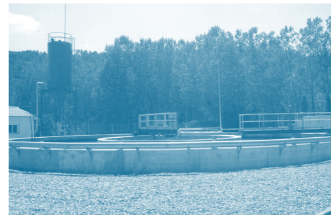
Vista de les instal·lacions de la depuradora de Carme.