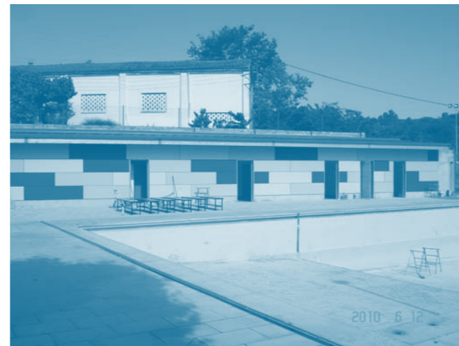
Imatge dels vestidors a punt d'estrenar.