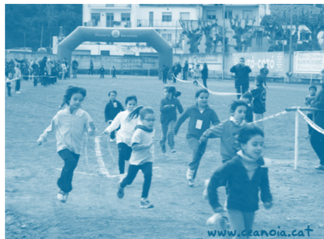
Imatge del cross escolar.