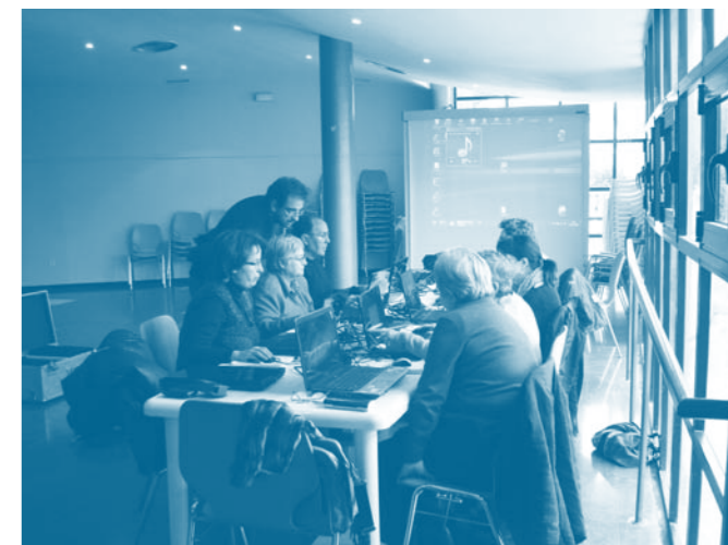
S'ha impartit un curs d'iniciació a la informàtica totalment gratuït pels alumnes fruit d'un conveni amb el Consell Comarcal de l'Anoia.