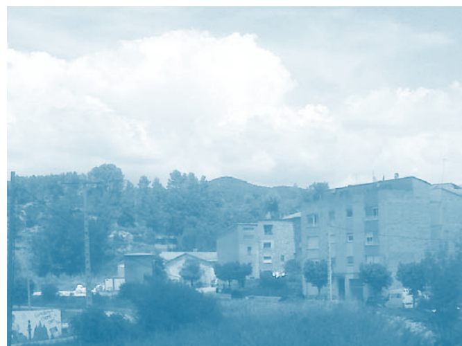
En aquesta zona es col·locarà la passera de vianants cap a la Solana

• S'ha elaborat un programa d'activitats per a la gent gran fruit de la incorporació de la nova dinamitzadora.