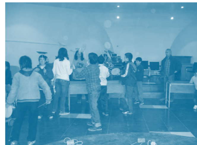
Bielofesta per col·laborar en l'acollida de nens de Bielorrússia.