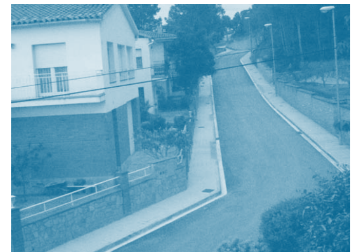
Estat actual del carrer dels Pins una vegada acabades les obres.