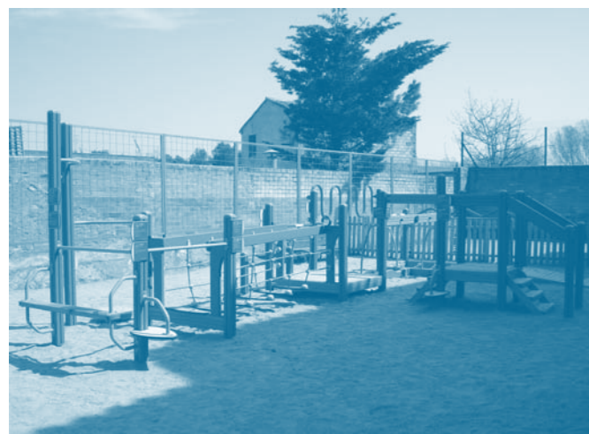
Espai lúdic i de salut per a la gent gran.

• L'Ajuntament de Carme utilitza diferents mitjans digitals per comunicar-se amb la gent: www.carme.cat , facebook/Ajuntament Carme i participacio.carme@carme.cat . Us animem a participar-ne.