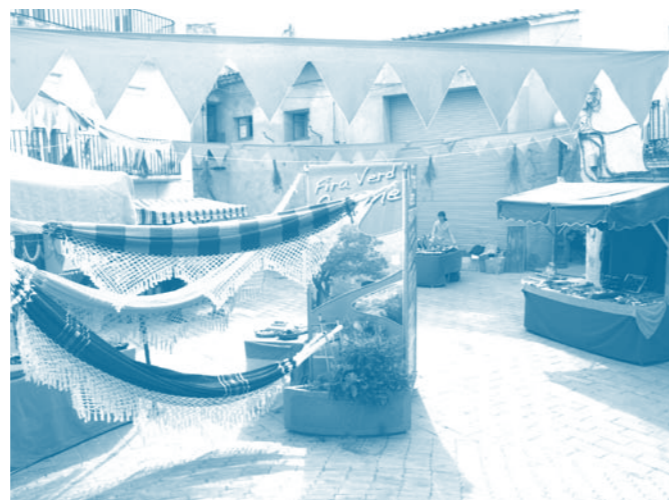
La fira d'artesans se suma a la fira de jardineria. Complementa i dona color al nucli antic.