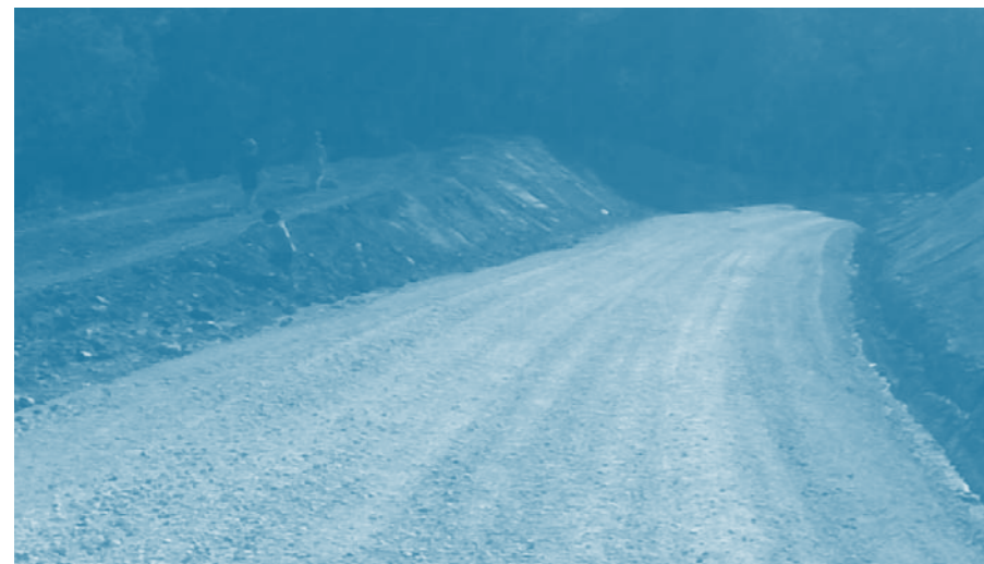
Arranjaments de camins de la Solana

dicionament i modernització de les instal·lacions del dipòsit d'aigua potable del poble.