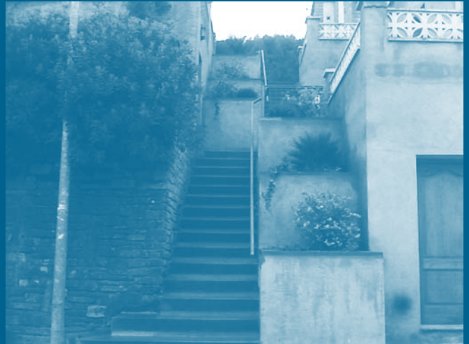
Escales arranjades al carrer de Sant Magí