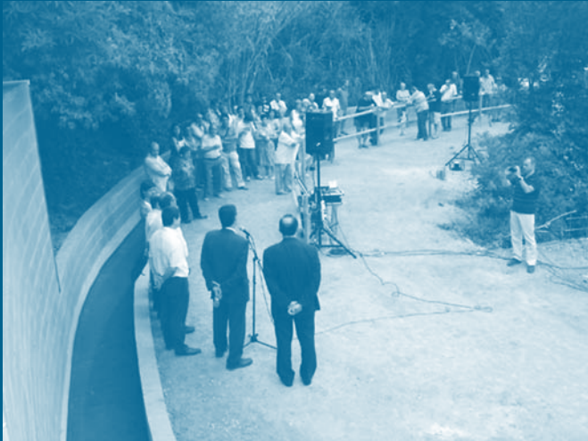
Parlaments de les autoritats al Rec