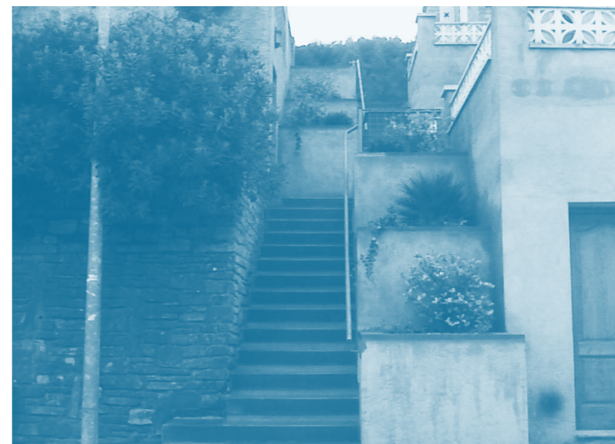
Les escales del carrer de Sant Magí

• Aprofitant la presència de les màquines d'asfaltatge al carrer Progrés, s'ha fresat i asfaltat la part