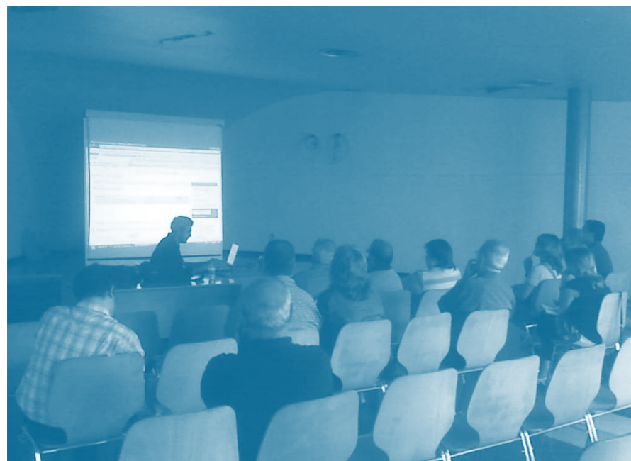
Reunió amb entitats per dissenyar el web: www.carme.cat

• Una primera fase del Projecte de recuperació de la Riera de Carme al seu pas pel poble es començarà a executar a partir del mes de juliol. Les obres consistiran, principalment, en configurar una llera baixa on es torni a veure l'aigua. El cost d'aquestes obres puja a 27.000€, un 70% dels quals va a càrrec de l'ACA, i el 30% restant, de l'Ajuntament de Carme.