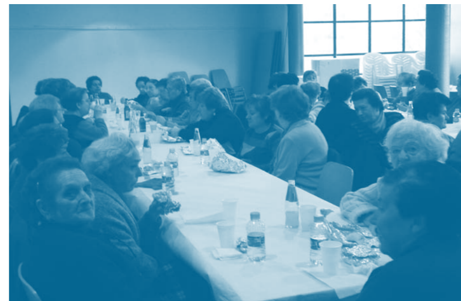
A Carme donem atenció a tots els col·lectius