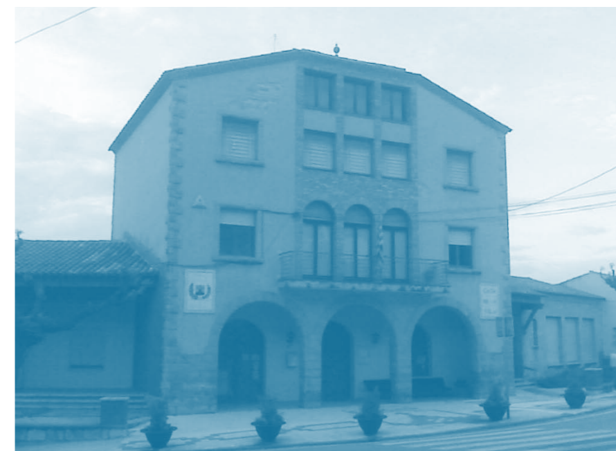
Imatge millorada de l'Ajuntament