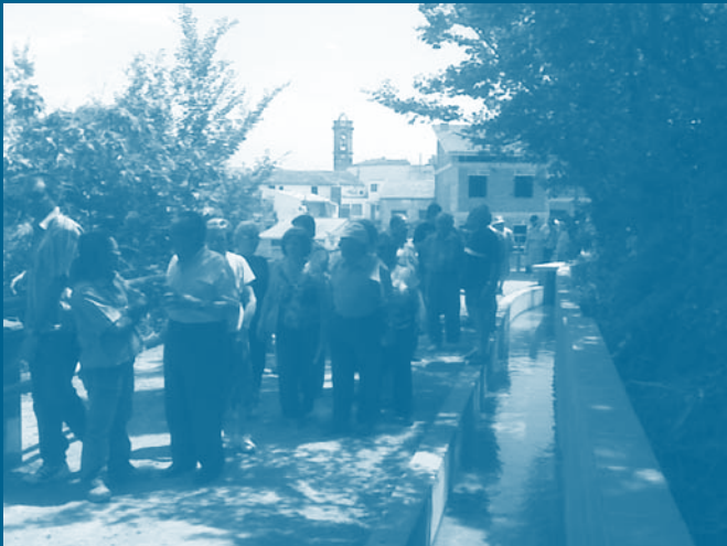
Gent passejant vora el Rec descobert